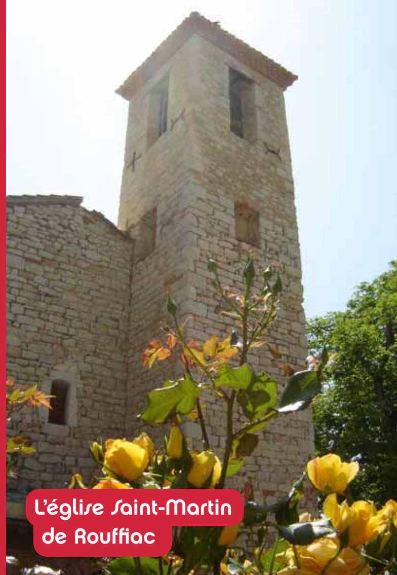
L'église Saint-Martin de Rouffiac

Avant d'arriver sur la route au point 8, prenez le temps d'observer les deux très beaux pigeonniers au lieu-dit « Le Bourg ». Le pigeonnier le plus près de l'ancienne ferme est caractéristique du type « Toulousain » : à deux pentes décalées, appelé aussi à « pied de mulet ». La couverture est en tuiles « canal ». Il date apparemment du XVIII e siècle et semble contemporain de l'ancienne ferme. Quelques mètres plus loin, l'autre pigeonnier est plus original. Il emprunte son style à deux types reconnus : « toulousain » pour sa toiture à trois pentes dont une inversée et de type « castrais » pour ses piliers à chapiteau et « champignon ». Cette forme curieuse empêchait les prédateurs de rentrer dans le pigeonnier : les rats et autres rongeurs ne pouvaient en effet escalader ces formes particulières. À observer : les trous d'entrée étaient presque tous orientés au soleil levant, certainement pour inciter les pigeons à se réveiller de bonne heure.